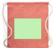
AREA 1 - Cara A

Áreas y técnicas de impresión recomendadas para éste artículo. Contacte con nosotros si sus necesidades son otras para estudiar las posibles alternativas.