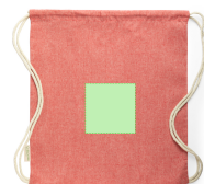
AREA 4 - Cara B