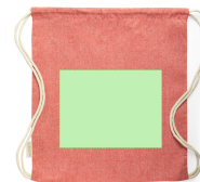
AREA 3 - Cara B