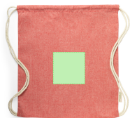
AREA 2 - Cara A